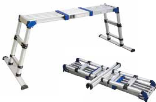
PLATE FORME TELECOSPIQUE

Dimensioni | Dimensions: 1670 x 690 x 1190 mm (L x W x H)