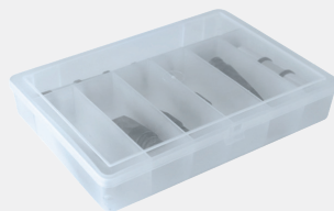
Boîte de transport.